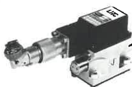
Type 952.032 Hautes performances Débit jusque 25 l/min.