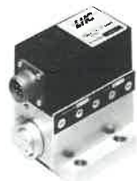
Gamme D 490 standard Gamme D 1490 haute réponse 5 tailles 3 à 70 l/min.